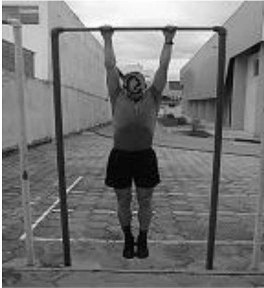
Figura 01 - Posição 1: Inicial

a.3) Número de repetições : Livre, a critério do candidato(a). Os pontos serão computados conforme tabela.