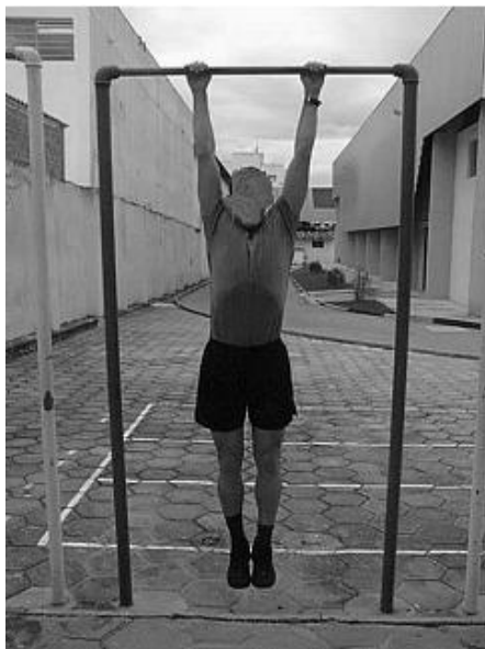
Figura 03 - Posição 3: Final do Exercício