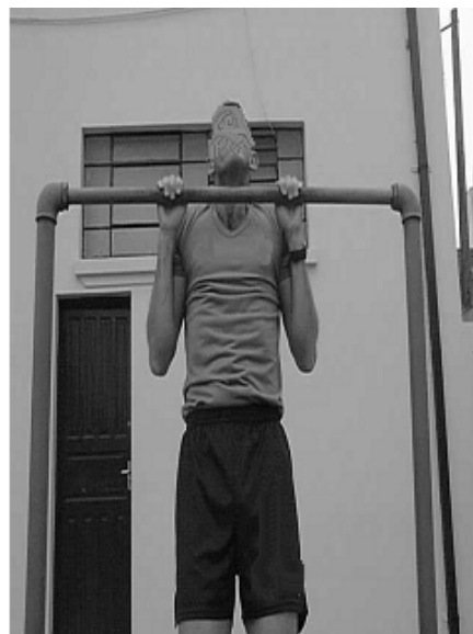
Figura 02 - Posição 2: Intermediária.