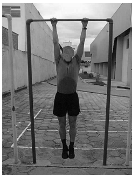
Figura 03 - Posição 3: Final do Exercício

b) Shuttle run (masculino e feminino) - Traduzido: corrida de ir e vir: