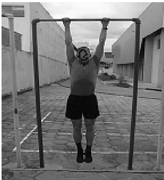
Figura 01 - Posição 1: Inicial

a.3) Número de repetições : Livre, a critério do candidato(a). Os pontos serão computados conforme tabela.